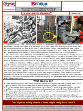
2017年10月號「明鑑 Beacons」是根據伊索寓言中《狼來了》的故事

如今沒有了這種經驗，我們就要依靠培訓、演習和程序書來安全地從事日常工作。但是當“做什麼”與“為什麼我們這樣做”之間沒有良好的關聯時，我們可能會變得自滿。為什麼我們必須遵循所有這些製程安全管理程序來防止從未發生過的事故？我們忘記了：正因為我們遵循規定的程序，所以事故才不會經常發生。規定的程序變得容易不被嚴格遵循。自滿和不遵守程序就是前往未來事故的第一步。