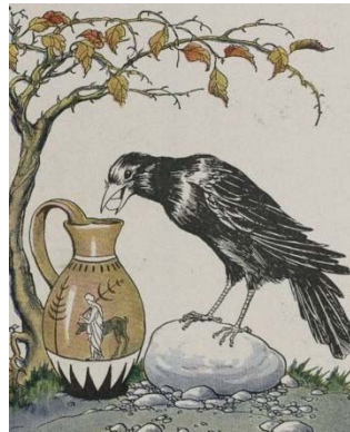
A Fábula de Esopo do corvo e da garrafa lembram-nos o valor da criatividade.