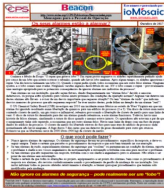
A base do Beacon de Outubro de 2017 é a Fábula de Esopo do rapaz que gritava lobo!

adequadamente. Sem esta experiência, confiamos na formação, simulacros e procedimentos para efetuar o nosso trabalho diário de uma forma segura. Quando não existe uma ligação entre “o que fazer” e “porque fazer desta forma” podemos tornar-nos complacentes. Porque é que temos que seguir todos estes procedimentos de gestão da segurança para evitar incidentes que nunca acontecem? Esquecemo-nos que os incidentes não acontecem com tanta frequência porque estamos a seguir os procedimentos requeridos. Os procedimentos tornam-se vulneráveis a não serem seguidos rigorosamente. A complacência e a falha no seguimento de procedimentos são alguns dos primeiros passos no caminho que conduz a um futuro incidente.