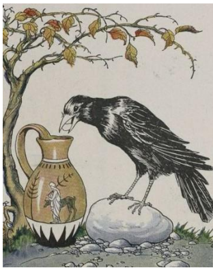
Aesop's fabel van de raaf en de waterkruik herinnert ons aan de waarde van creativiteit