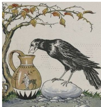
Aesop's Fable of the Raven and the Pitcher reminds us of the value of creativity.