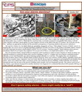
The October 2017 Beacon is based on Aesop's Fable of the Boy Who Cried Wolf.

Tanpa pengalaman itu, kami bergantung kepada latihan, dril, dan prosedur bagaimana cara kerja harian kami dengan selamat. Apabila tidak ada hubungan yang baik antara "apa yang perlu dilakukan" dan "mengapa kita melakukannya dengan cara itu" kita boleh menjadi leka. Mengapa kita perlu mengikuti semua prosedur pengurusan keselamatan proses ini untuk mengelakkan insiden yang tidak pernah berlaku? Kami lupa bahawa insiden tidak berlaku begitu kerap kerana kami mengikuti prosedur yang diperlukan. Prosedur menjadi terdedah kepada tidak diikuti dengan ketat. Kelalaian dan kegagalan untuk mematuhi prosedur adalah beberapa langkah pertama menuju insiden masa depan.