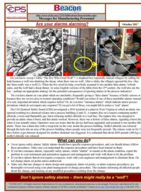
Il Beacon di ottobre 2017 è basato sulla fiaba "Al lupo al lupo" di Esopo.

Senza queste esperienze, per utilizzare in sicurezza gli impianti, si può fare affidamento sulle procedure, la formazione e le esercitazioni. Se manca il collegamento tra “cosa fare” e “perché si fa così” si rischia di diventare compiacenti. Perché dobbiamo rispettare tutte queste procedure di sicurezza di processo per prevenire incidenti che non avvengono mai? Ci scordiamo però che gli incidenti non avvengono spesso perché stiamo seguendo le procedure richieste. Esiste quindi il rischio che le procedure non vengano seguite rigorosamente. Compiacenza e mancanze nel seguire le procedure sono alcuni dei primi passi nel percorso che conduce ad un futuro incidente.