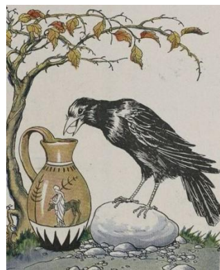
Æsop's fabel om kragen og [vand]krukken minder os om værdien af kreativitet.