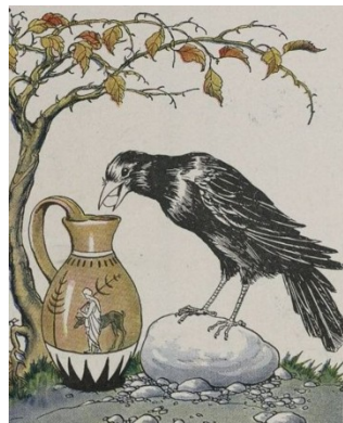
La faula d'Isop del corb i la gerra ens recorda el valor de la creativitat.

El pioner en seguretat de procés Trevor Kletz (1922-2013) sovint va escriure sobre el valor dels contes en la seguretat de procés. Hom recorda els contes, i els recorda de forma molt més fiable que les conferències sobre els perills del procés i altres materials de formació. Afortunadament, les indústries de procés han avançat significativament en la reducció de la freqüència d'incidents importants. En el passat, les persones que treballaven en instal·lacions de procés es van tornar prudents en experimentar els perills