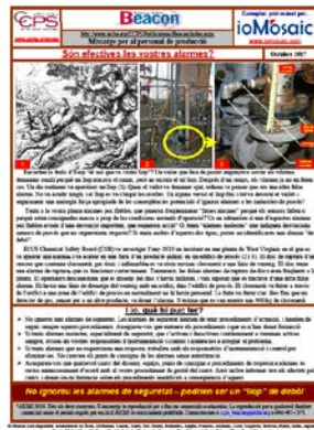
El Beacon d'octubre de 2017 es basa en la faula del noi que va cridar llop.