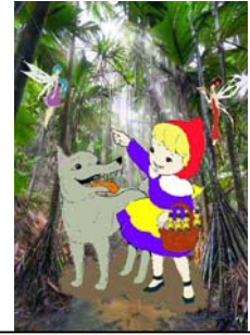
Rooikappie en die wolf