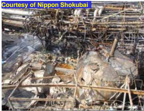
Hình 1: Bể AA bị phá hủy