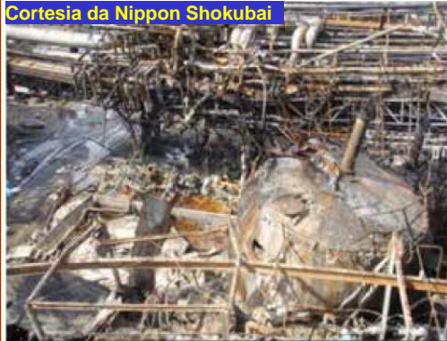
Figura 1: Tanque de AA destruído