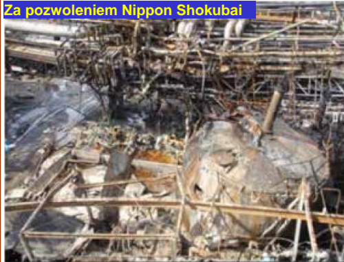
Zdjęcie 1: zniszczony zbiornik kwasu akrylowego