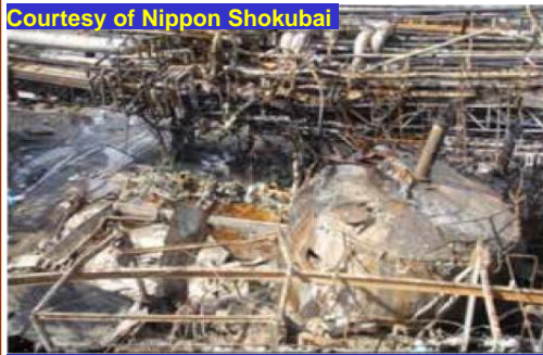
Afb. 1: Vernielde Acrylzuur Tank