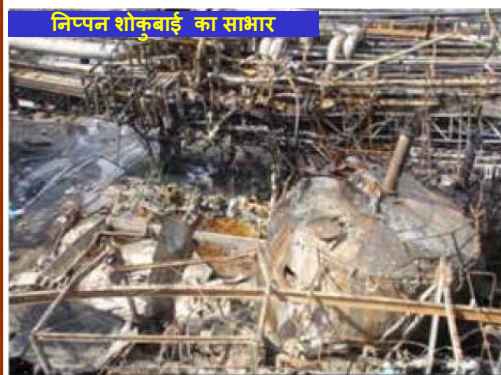
निम्पन शोकबाई का साधार

विस्फोट के समय, सन्यंत्र एक आसवन स्तम्भ (distillation column) का परीक्षण कर रहा था, जिस के लिये इस टैंक से आपूर्ति करना आवश्यक था। टैंक का स्तर धीरे धीरे प्रारम्भिक प्रचालन स्तर तक बढ़ गया। टैंक के ऊपरी स्तर तक द्रव्य को बिना ऊपर ले जाये हुये, शीतलन कुंडली (coil) से ऊपर के स्तर पर ऐ ऐ पूरी तरह से मिला नहीं हुआ था। ऐसा माना जाता है कि आने वाली ऐ ऐ बहुलीकरण के लिये आवश्यक तापमान से भी कम था, और ऐ ऐ में बहुलीकरण निरोधक रसायन विद्यमान थे, परन्तु फिर भी टैंक का तापमान बढ़ गया, विशेषतया: ऊपरी भाग में। अन्ततः टैंक का दबाव बढ़ गया और उस में विस्फोट हो गया।