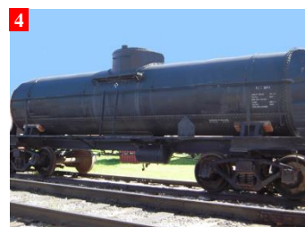
设备老化的例子： 2. 料仓 3. 分离设备 4. 柳接贮罐车