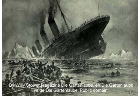
By Willy Stöwer Magazine Die Gartenlaube, en:Die Gartenlaube ve de:Die Gartenlaube, Public domain.