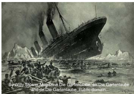
By Willy Stöwer Magazine Die Gartenlaube, in: Die Gartenlaube and de:Die Gartenlaube, Public domain.