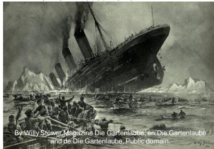
By Willy Stöwer, Magazine Die Gartenlaube, en:Die Gartenlaube and de:Die Gartenlaube, Public domain.