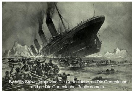
By Willy Stöwer, Magazine Die Gartenlaube, en:Die Gartenlaube and de:Die Gartenlaube, Public domain.