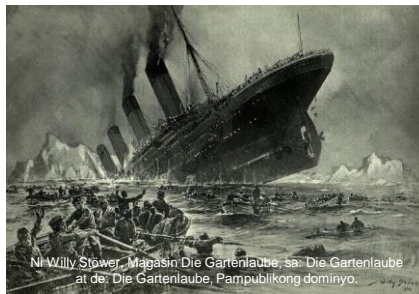
Ni Willy Stöwer, Magazin Die Gartenlaube, sa: Die Gartenlaube at da: Die Gartenlaube, Pampublikong dominyo.