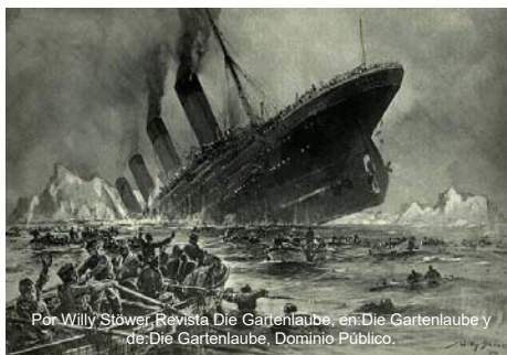
Por Willy Stöwer, Revista Die Gartenlaube, en Die Gartenlaube y de Die Gartenlaube, Dominio Público.