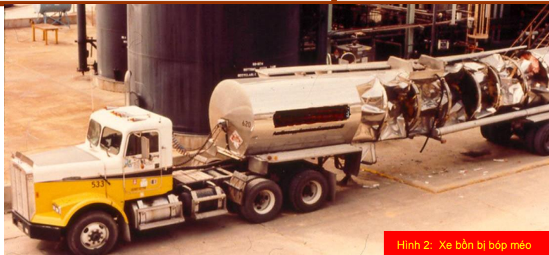
Hình 2: Xe bồn bị bóp méo

Ở sự cố 2, họ đã không tiến hành xem xét thay đổi trước khi thực hiện những việc tương tự như là nhỏ như vậy bởi chủ xe bồn. Lái xe bồn đã hiểu sai về vận hành cái loại van mới được lắp đặt đó. Trong lúc chuẩn bị cho việc xả hàng và anh ta đã vô tình đã để cái van trên đường dẫn N 2 ở đỉnh xe bồn về trạng thái đóng.