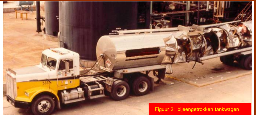
Figuur 2: bijeengetrokken tankwagen

Bij incident 2 , was er geen MOC beoordeling gemaakt wegens naar wat leek een kleine aanpassing die uitgevoerd was door de eigenaar van de tankwagen. De chauffeur begreep de werking van het nieuwe type ventiel niet en liet per ongeluk het ventiel in gesloten positie staan bij de voorbereidingen voor het ontladen van de tankwagen.