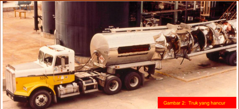
Gambar 2: Truk yang hancur

Di kejadian 2, tidak ada review MOC untuk perubahan yang terlihat kecil itu. Dan dilakukan oleh pemilik truk. Supir truk salah mengerti pengoperasian valve baru tersebut dan dia secara tidak sengaja membiarkan valve nitrogen di atas truk dalam posisi tertutup ketika mengosongkan isi truk.