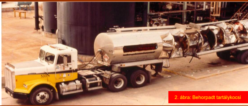
2. ábra: Behorpadt tartálykocsi

A 2. esemény esetében nem történt változáskezelés, mivel a teherautó tulajdonosa azt apró változtatásnak ítélte. A tehergépkocsi-vezető félreértette az új típusú szelep működését, és véletlenül zárt helyzetben hagyta a nitrogénszelepet a tartálykocsi tetején, amikor előkészítette annak lefejtését.