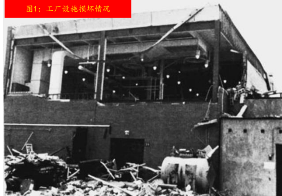
图1: 工厂设施损坏情况

1986年，一家试验工厂内的一台10加仑（约38升）容量的搅拌器发生了爆炸。当时容器内是在纯氧的气体环境下，进行着氧化反应，压力为250 psig（1825kPa）。人们认为该容器内的气体是安全的，不会被点燃，这是因为通过控制，容器内的物料温度比其氧气环境下的闪点温度还要低，达50℃，而且物料气体的浓度低于其爆炸下限（LEL）。当时工艺稳定地运行了41分钟，随后突然发生了爆炸。它使得这个设计压力为750 psig（约5200kPa）的反应器破裂，并使整套设施遭到严重破坏（见图1），并引发了几处较小的火情，幸运的是没有人受伤。