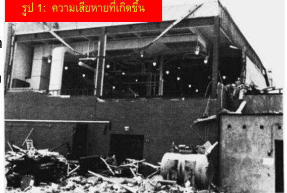
รูป 1: ความเสียหายที่เกิดขึ้น

เพราะว่าอุณหภูมิในถังอยู่ต่ำกว่าจุดวาบไฟของสารผสม ไอของสารที่เป็นเชื้อเพลิง ในถังมีความเข้มข้นต่ำกว่าค่าที่จะเกิดลุกติดไฟได้ จึงไม่น่าจะมีอันตรายจากการระเบิด แต่ว่าเชื้อเพลิงอาจไม่จำเป็นต้องอยู่ในรูปของไอเท่านั้น (เช่นกรณีการระเบิดของฝุ่น) จากการสืบสวนพบว่าใบกวนของถังทำให้เกิดละอองเล็ก ๆ ของของเหลว (รูป 2) ละอองมีขนาดเฉลี่ยประมาณ 1 ไมครอน ถ้าเปรียบเทียบกัน ขนาดเส้นผ่าศูนย์กลางของเส้นผมคนเราจะมีขนาดใหญ่กว่าละอองเล็ก ๆ นี้ประมาณ 40-50 เท่า จากการทดสอบพบว่าละอองเล็ก ๆ ของของเหลวนั้นสามารถติดไฟได้ในอากาศที่อุณหภูมิห้อง และจะยิ่งติดไฟได้ง่ายขึ้นอีกในสถานะที่มีออกซิเจน 100% ดังนั้นจึงมีทั้งเชื้อเพลิงและออกซิเจน – แต่ว่าแหล่งที่ก่อให้เกิดประกายไฟมาจากไหน? แม้ว่าบ่อยครั้งยากที่จะระบุถึงแหล่งที่ก่อให้เกิดประกายไฟจนทำให้เกิดการระเบิดได้ แต่จากการสืบสวนสรุปว่าแหล่งที่น่าจะเป็นไปได้มากที่สุดคือสารปนเปื้อน ที่เหลือค้างจากการทดลองครั้งที่แล้ว ซึ่งสลายตัวและเกิดความร้อนมากพอที่จะทำให้ละอองเล็ก ๆ ติดไฟ