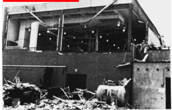
Fig. 1: Skador på byggnaden

[Referens: Kohlbrand, H. T., Plant/Operations Progress 10 (1), pp. 52-54 (1991).]