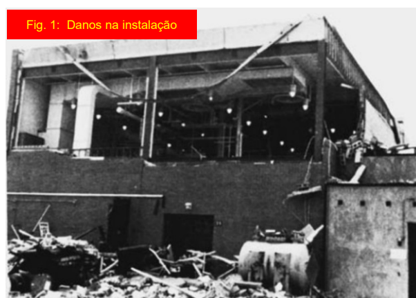
Fig. 1: Danos na instalação

Porque o reator estava a operar abaixo do flash point do conteúdo, a concentração de vapor de fuel na atmosfera do reator era muito baixa para a ignição. Não deveria haver perigo de explosão. Mas o fuel pode não estar presente apenas na forma de vapor (lembrar as explosões de pó). A investigação determinou que o agitador do reator criou uma névoa fina de gotículas de líquido (Fig. 2). Estimou-se que as gotículas tinham um tamanho médio de cerca de 1 micron. Em comparação, o diâmetro de um cabelo humano é 40-50 vezes maior que as gotículas de névoa. Testes de inflamabilidade mostraram que a névoa podia entrar em ignição à temperatura ambiente em ar – e a névoa entra em ignição ainda mais facilmente numa atmosfera de oxigénio puro. O reator continha fuel e oxigénio – mas qual foi a fonte de ignição? Apesar de frequentemente ser difícil de identificar a fonte de ignição para uma explosão, a investigação determinou que a fonte de ignição mais provável foi um contaminante que foi deixado de outra experiência no reator, que se decompôs e gerou calor suficiente para provocar a ignição da névoa.