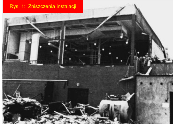
Rys. 1: Zniszczenia instalacji