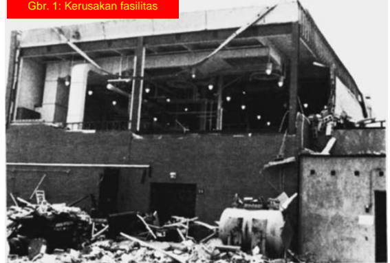
Gbr. 1: Kerusakan fasilitas

[Reference: Kohlbrand, H. T., Plant/Operations Progress 10 (1), pp. 52-54 (1991).]