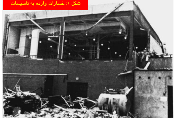
شکل ۱: خسارات وارده به تاسیسات

بخارات سوخت در فضای داخل ظرف خیلی کم بود. بنابراین نمی بایست خطر انفجار وجود داشته باشد. ولی احتمالاً مواد سوختی تنها به صورت بخار نبوده است (انفجار گرد و غبار را بیاد بیاورید). بررسی ها نشان داد که همزن موجود در ظرف قطرات ریز مایع (Mist) را ایجاد کرده است. تخمین زده می شود که قطر این قطرات ریز بطور متوسط ۱ میکرون بوده است. در مقام مقایسه، قطر موی انسان ۵۰-۴۰ برابر بزرگتر از اندازه این قطرات مایع می باشد. آزمایش قابلیت اشتعال نشان داد که قطرات ریز مایع می توانند در دمای معمولی مشتعل شوند، حتی در شرایط حضور اکسیژن خالص خیلی سریعتر مشتعل خواهد شد. ظرف محتوی هر دو عامل اکسیژن و سوخت بوده، ولی منبع حرارت و شروع اشتعال چه بوده است؟ اگر چه اغلب اوقات منبع تامین حرارت مورد نیاز انفجار بسیار سخت و مشکل است، ولی بررسی ها حاکی از آن است که به احتمال بسیار زیاد تجزیه ی آلودگی باقیمانده در ناشی از آزمایشات قبلی سبب شده تا حرارت مورد نیاز جهت اشتعال و انفجار قطرات مایع تامین گردد.