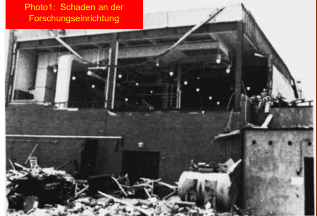
Photo1: Schaden an der Forschungseinrichtung

Weil der Reaktor bei einer Temperatur unterhalb des Flammpunktes des enthaltenen Gemisches betrieben wurde, war die Konzentration an brennbaren Dämpfen in der Gasphase zu niedrig für eine Zündung. Darauf bezogen hätte keine Explosionsgefahr bestehen sollen. Die Untersuchung ergab jedoch, dass der Tankrührer einen feinen Nebel aus Flüssigkeitströpfchen (Aerosol) produzierte (Bild 2). Die winzigen Tröpfchen hatten eine geschätzte Durchschnittsgröße von ca. 1 Micron (zum Vergleich: der Durchmesser eines menschliches Haares ist 40-50 mal größer, als der eines Tröpfchens). Flammbarkeitstests bewiesen, dass der feine Tröpfchennebel bei Raumtemperatur in Luft gezündet werden konnte und folglich in reiner Sauerstoffatmosphäre noch leichter entflammbar war. Das Gefäß enthielt Brennstoff und Sauerstoff, aber was war die Zündquelle? Auch wenn schwierig zu beweisen, so wird als wahrscheinlichste Zündquelle eine Verunreinigung angenommen, ein Überbleibsel aus einem vorangegangenen Versuch im gleichen Gefäß, welche sich zersetzte und dabei genug Wärme entwickelte um den Nebel zu zünden.