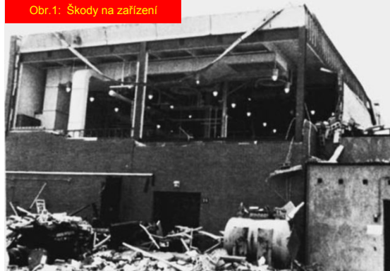
Obr. 1: Škody na zařízení

Vzhledem k tomu, že nádoba byla provozována pod teplotou bodu vzplanutí obsažených látek, byla koncentrace hořlavých par příliš nízká pro jejich vzplanutí. Nebezpečí výbuchu zde nemělo hrozit. Avšak hořlavá látka nemusí být přítomná pouze ve formě par (vzpomeňte si na výbuchy prachu). Vyšetřováním bylo zjištěno, že míchadlo v nádobě vytvořilo jemné kapičky aerosolu (Obr. 2). Průměrná velikost drobných kapiček se odhadovala kolem 1 mikrometru. Pro srovnání, průměr lidského vlasu je 40 až 50krát větší než tyto kapičky aerosolu. Testy hořlavosti prokázaly, že tento aerosol se mohl vznítit ve vzdušné atmosféře při pokojové teplotě - a aerosol v kyslíkové atmosféře by se vznítit ještě snadněji. Nádoba obsahovala jak hořlavou látku, tak kyslík - ale co bylo zdrojem zapálení? I když je při výbuchu často obtížné určit zdroj zapálení, vyšetřováním se došlo k závěru, že nejpravděpodobnějším zdrojem zapálení byla nečistota (kontaminant), která zbyla po předchozím pokusu v nádobě. Nečistota se rozložila a vygenerovala dostatečné množství tepla k zapálení směsi.