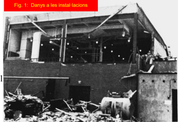
Fig. 1: Danys a les instal·lacions

Com que el recipient treballava per sota del flash point del contingut, la concentració de vapors combustibles a la seva atmosfera era massa baixa per a la ignició. No hi hauria d'haver risc d'explosió. Però el combustible pot no ser un vapor (recordeu les explosions de pols). La investigació va determinar que l'agitador creava una boira fina de gotetes de líquid (Fig. 2). Es va estimar que les gotetes tenien un diàmetre mitjà d'una micra. A tall d'exemple, el diàmetre d'un cabell humà és de 40 a 50 vegades més gran que el de les gotetes. El assajos van demostrar que la boira es podia inflamar a temperatura ambient en aire – encara amb més facilitat en una atmosfera d'oxigen pur. El recipient contenia combustible i oxigen – però quina va ser la font d'ignició? Encara que sovint és difícil identificar la font d'ignició d'una explosió, la investigació va determinar que la font d'ignició més probable era un contaminant, deixat després d'un assaig previ en el recipient, que es va descomposar generant suficient energia per inflamar la boira.