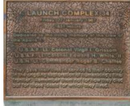
Placa no complexo de lançamento