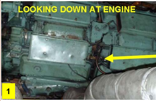
LOOKING DOWN AT ENGINE